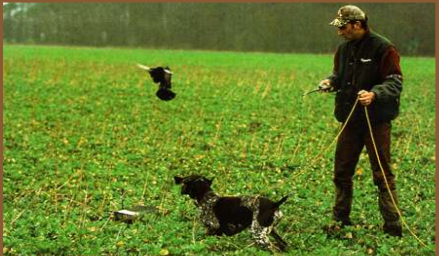
Der Führer bestimmt durch Knopfdruck den Zeitpunkt, an dem das „Übungswild“ vom Hund abstreicht. Jetzt kann er, falls erforderlich, ganz gezielt einwirken