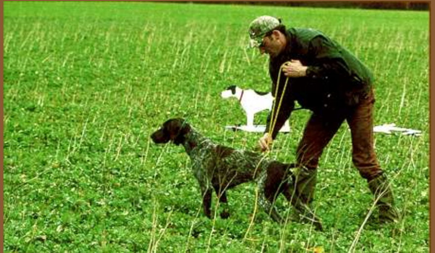
Da muß doch irgendetwas sein... Jetzt wendet sich auch der Azubi angespannt in die vermeintliche Vorstehe-Rechtung, zieht an und steht mit vor