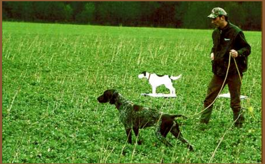
Erägt der suchende Hund die urplötzlich vor ihm auftauchenden „Pappkameraden“ in Vorstehpose, folgt zunächst ein kurzes Überraschungsmoment