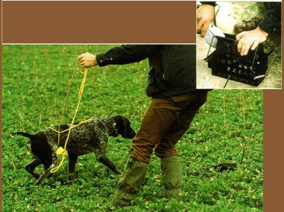
Sowie der Hund an der langen Feldleine Witterung von der Haustaube im „Werfer“ (kleines Foto) bekommen hat, wird es spannend