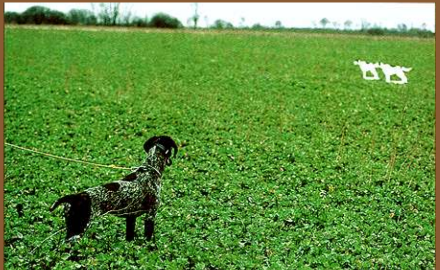
Die jetzt zusätzlich locker um die Hüfte des Hundes geschlungene Feldleine macht ihm - im Fall des Falles - Einspringen und Nachprellen „doppelt schwer“